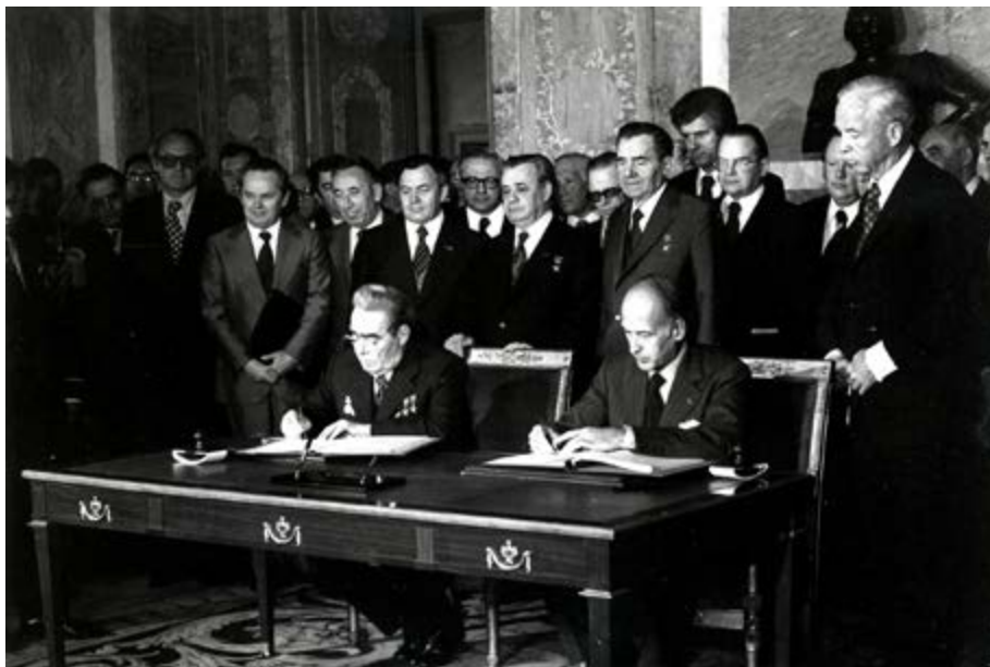
Voyage officiel de Leonid Brejnev en France, signature des accords Franco-Russes à Rambouillet 20-22 juin 1977 Ministère de l'Europe et des Affaires étrangères, Centre des Archives diplomatiques de La Courneuve, Collection iconographique, A019746 © Ministère des Affaires étrangères