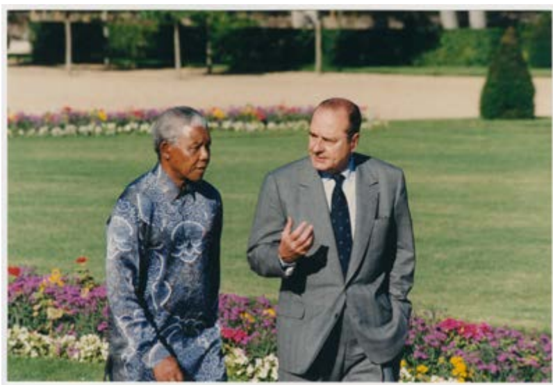
France, Rambouillet Visite d'Etat en France de Nelson Mandela, Président d'Afrique du Sud. Entretien 13 juillet 1996

La restauration de l'appartement a reçu le soutien de Dassault Histoire et Patrimoine et de la société ADEQUATI.