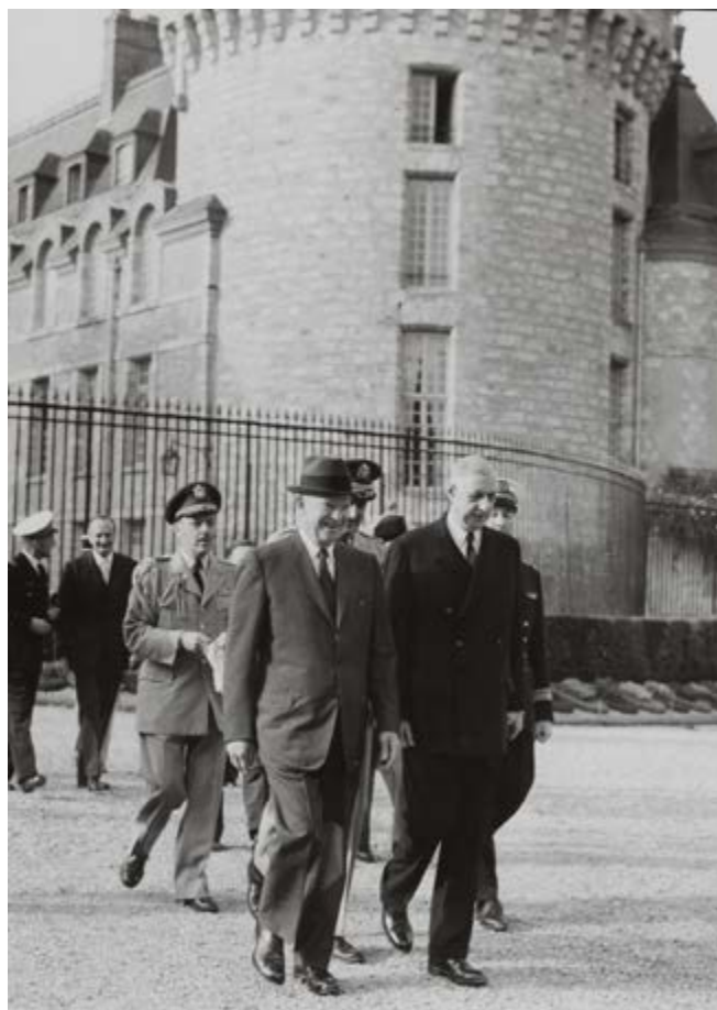
De Gaulle et le président Eisenhower à Rambouillet 2 février 1959 Ministère de l'Europe et des Affaires étrangères, Centre des Archives diplomatiques de La Courneuve, Collection iconographique, AO47711 © Universal Photo

Grâce à un partenariat exceptionnel avec le Mobilier national, les ensembles créés pour Rambouillet sous la présidence de Vincent Auriol par les plus grands créateurs de l'époque tels André Arbus, Raymond Subes ou Jean Pascaud, ont ainsi retrouvé leur cadre d'origine.