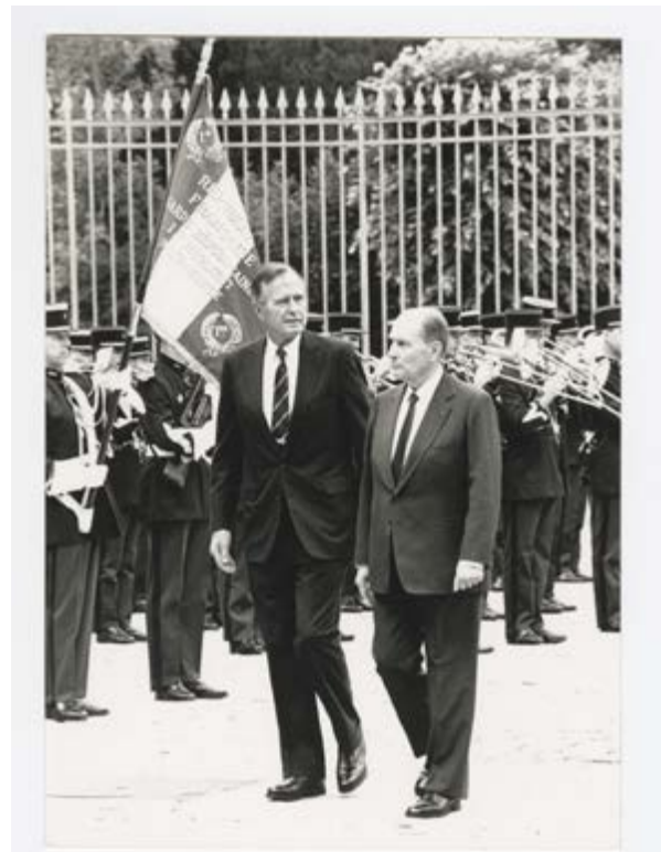
Visite en France de George W. Bush, Président des Etats-Unis, 14 juillet 1991 A106981

La Fondation Valéry Giscard d'Estaing a apporté son précieux concours au CMN en réunissant des témoignages qui ont permis de restituer fidèlement le quotidien du Président et de sa famille à Rambouillet. Agrémentés de téléphones d'époque, livres et objets courants, ces espaces reprennent vie, tandis qu'un téléviseur diffuse des extraits de l'INA sur le Sommet du G6. Un court film dévoile les secrets d'une activation ou comment la résidence présidentielle de Rambouillet se prépare à accueillir une rencontre diplomatique. Les visiteurs découvriront des interviews exceptionnelles de grands témoins : Louis Valéry Giscard d'Estaing, Jean-David Levitte, Jean-Claude Trichet, Robert Hormats qui fut «sherpa» (représentant personnel d'un chef d'État ou de gouvernement pour la préparation des sommets du G7) de Gerald Ford en 1975 ou encore Walter Lutringer, majordome du Président, et Geoffroy de Roquancourt.