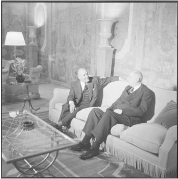
© Archives nationales (France), AG//SPH/22, Reportage n°1379, cliché 4. Voyage en France de Habib Bourguiba, président de Tunisie, séjour au château de Rambouillet. 27 février 1961