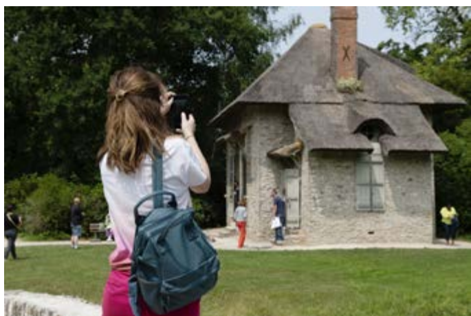
Domaine national de Rambouillet, visiteurs

En se connectant sur www.mapierrealedifice.fr , les amoureux du patrimoine peuvent faire un don pour le château de Rambouillet (« Mon monument préféré ») et ainsi contribuer à l'animer, l'entretenir et le préserver.