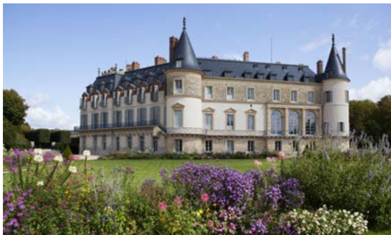
Château de Rambouillet, façade sur le jardin et façade sur le grand canal

Rambouillet est l'exemple unique d'un château qui a connu à la fois l'Ancien Régime, l'Empire et la République. Situé à proximité de Versailles, et à une cinquantaine de kilomètres de Paris, il offre un refuge parfait pour goûter un peu de quiétude à côté des coeurs battants du pouvoir. A cela s'ajoute la présence de l'une des plus belles forêts d'Île-de-France, réputée pour la qualité de ses chasses. Véritable havre de paix, le lieu est donc idéal pour combiner vie de famille et rencontres diplomatiques de haut vol, dans un style décontracté. De quoi attirer ici les plus grandes figures de notre Histoire telles que Louis XVI, Napoléon I er , ou encore Charles de Gaulle.