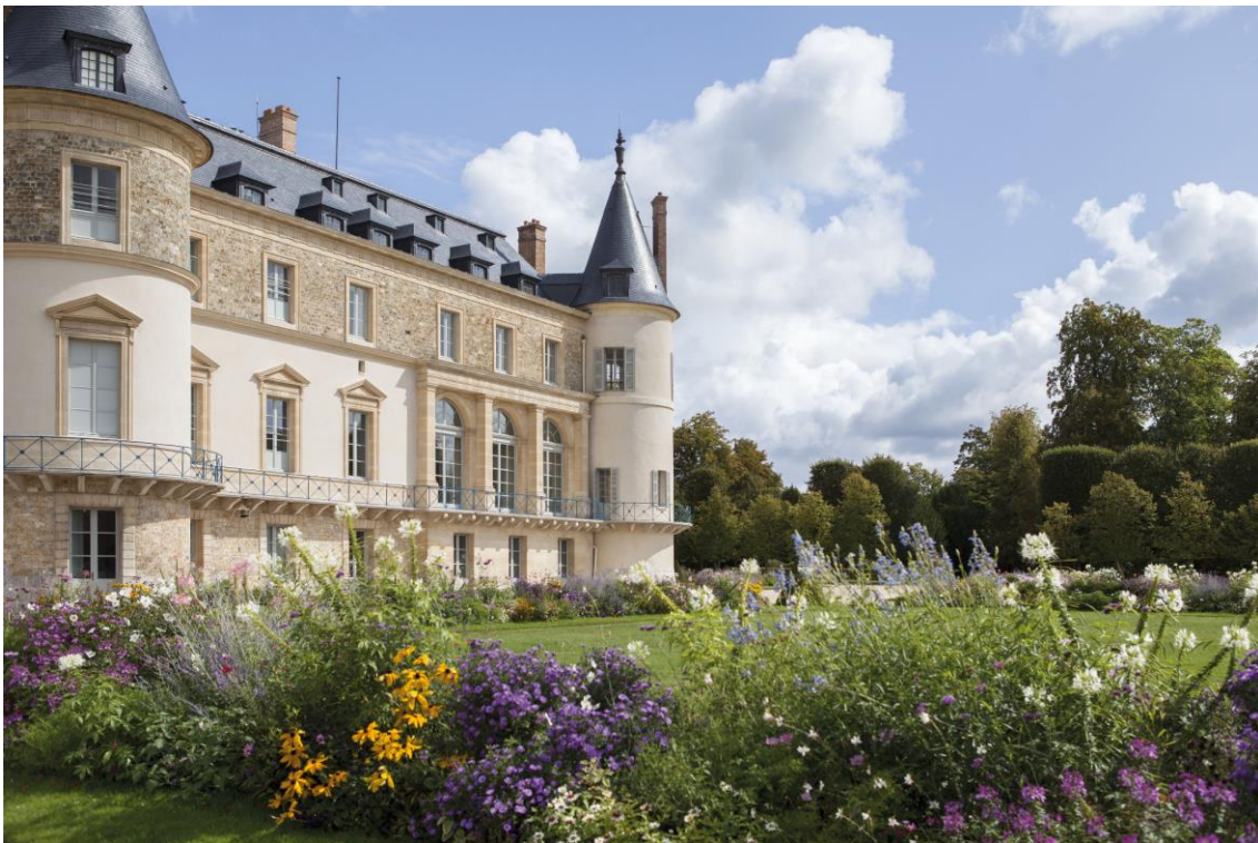
Vue de la façade du château de Rambouillet - jardin à la française